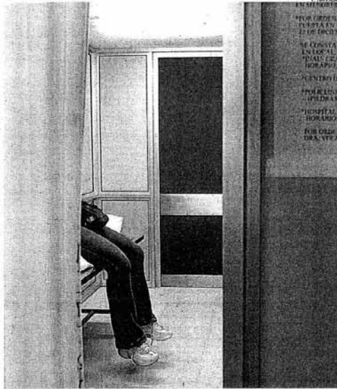
TERAPIA. El gobierno quiere brindar atención psicológica en Salud Pública

nuevo ministro de Salud, Daniel Olesker, señaló que "lo que hay actualmente (en las instituciones de salud) es psicodiagnóstico más que análisis", y entiende que "la terapia debería estar incluida (como prestación obligatoria) aunque "al principio quizá tenga que tener un copago" para regular la demanda de los usuarios.